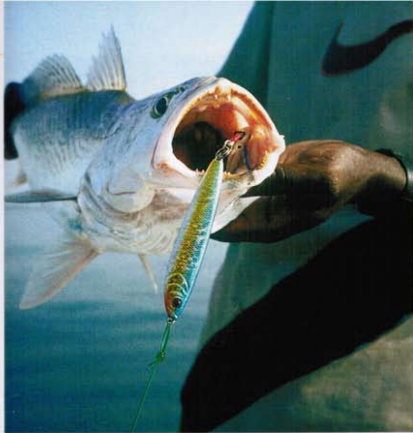
▲ Blue Fox Herring