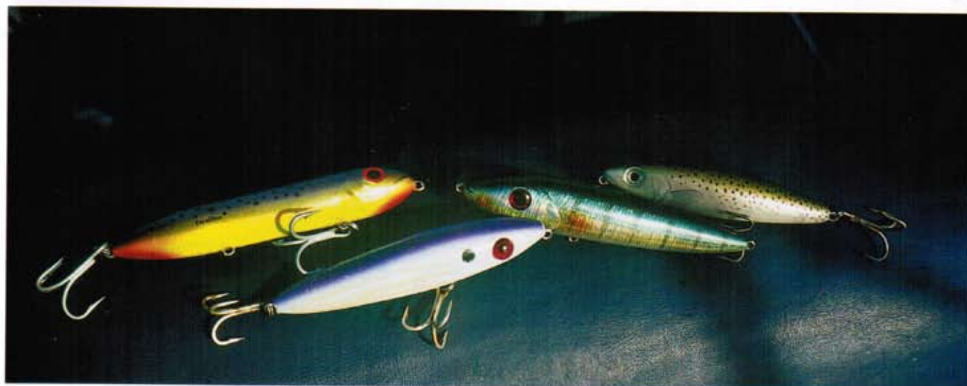
De gauche à droite : Super Spook, Top Dog, Swimmy, Skitter Walk. ▼