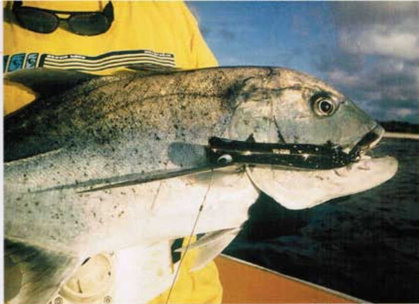
▲ Yo-Zuri Surface Bull