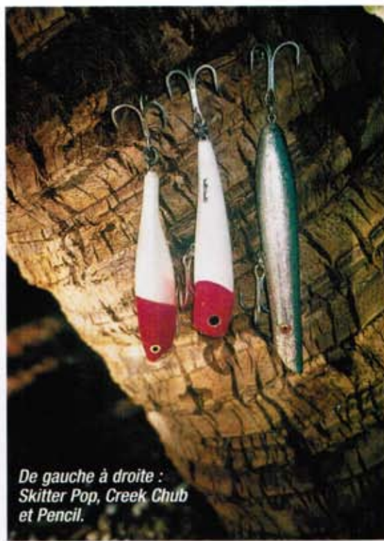
De gauche à droite : Skitter Pop, Creek Chub et Pencil.

Avec ce trio, vous êtes sûrs de réussir aux Bijagos, à Cuba, au Mexique ou encore sur les « petits » poissons de l'Océan Indien type carangue bleue et ignobilis de 5 à 15 kilos. Parfaits pour pêcher avec de la tresse de 20 à 30 livres et montés sur un bas de ligne fluorocarbonate 80 livres ou acier 30 kilos, il suffit de changer l'armement d'origine pour du costaud : anneaux 50 kilos et triples VMC Fish Fighter 2/0 ou Owner ST66 1/0. Le Pencil Cordell de 15 cm pour 28 g et 17 cm pour 56 g (4 coloris) n'est pas un vrai popper, il glisse et ricoche en surface, c'est sa nage de fuite rapide qui excite les prédateurs. Le Creek Chub 13 cm pour 40 g (8 coloris) est un popper articulé dont la nage peut être « travaillée », rapide et percutante, ou lente et sinueuse ce qui est particulièrement efficace tôt le matin ou par mer calme. Le Skitter Pop 12 cm pour 40 g (10 coloris) est un modèle bien fini, passe-partout, très efficace aux Bijagos et à Cuba sur les carangues, carpes rouges, barras et gros baby tarpons. Prix : environ 12€ le Pencil, 21 € le Creek Chub et 15 € le Skitter Pop.