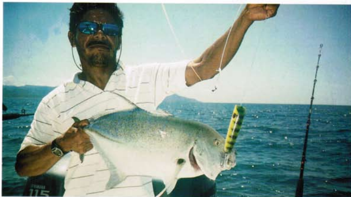
◀ Orion Big Nose