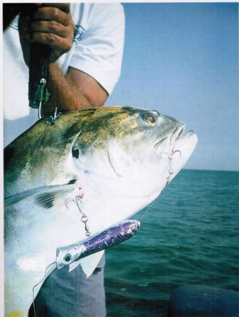
▼ Sert Killer Pop

S'il n'y en avait qu'un à emporter au Gabon ou à Madagascar par pack de 6, ce serait lui. Tout d'abord on le trouve dans presque toutes les bonnes boutiques de France et ensuite il est d'une efficacité et d'une solidité qui ne sont plus à prouver. Pour le faire popper un peu plus fort, n'hésitez pas à creuser un peu la tête pour la rendre plus concave. Conçu en mousse dense Uréthane il possède une armature inox renforcée. Taille unique de 20 cm pour 100 g. Armement d'origine à changer pour des Owner 4/0 et anneaux brisés 200 livres minimum si vous partez au Gabon ou dans l'Indo-Pacifique. Onze coloris. Prix : environ 30 €.