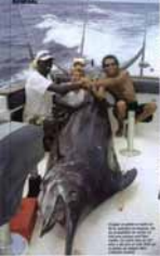
Sharks are being harvested for their fins, which are used in shark fin soup. The shark is being held on the deck of a boat in the Philippines.

...the shark's head, which is used for shark fin soup. The shark is being held on the deck of a boat in the Philippines.